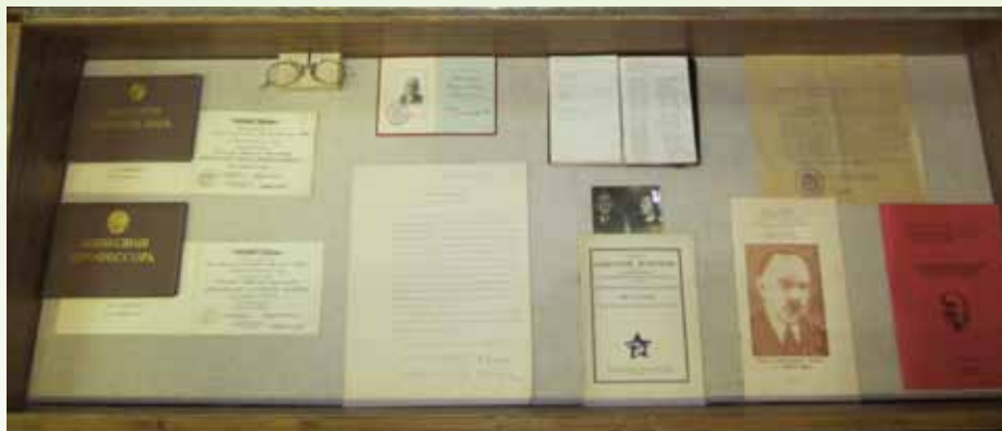
Фрагмент экспозиции об В.В.Алехине в Музее Природы