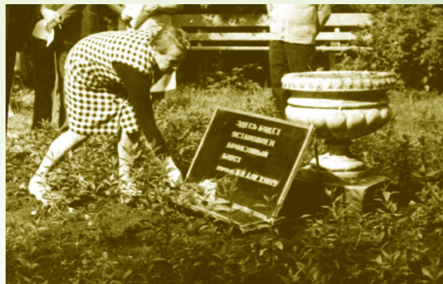
Невестка Алехина возлагает цветы к месту закладки памятника