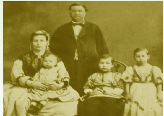
Семья деда Алехина (в центре - отец В.В. Алехина)

Основу благосостояния семьи Алехиных заложил их дед, начавший работу пастухом, впоследствии открывший собственное дело – торговлю мехами. Своим детям он обеспечил хорошее по тому времени образование, хотя сам развил себя только постоянным чтением. Отец Алехина принял и поддерживал налаженное дело. Он собрал большую библиотеку и был в Курске одним из основателей общества любителей драматического искусства.