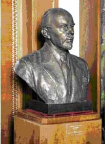
Бюст В.В. Алехину на кафедре геоботаники МГУ