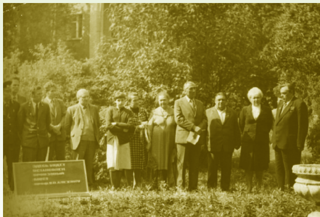
Закладывание памятника Алехина