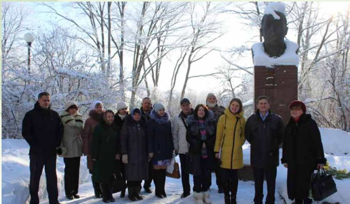
У памятника В.В. Алехину, 17 января 2017 г. (пос. Заповедный)