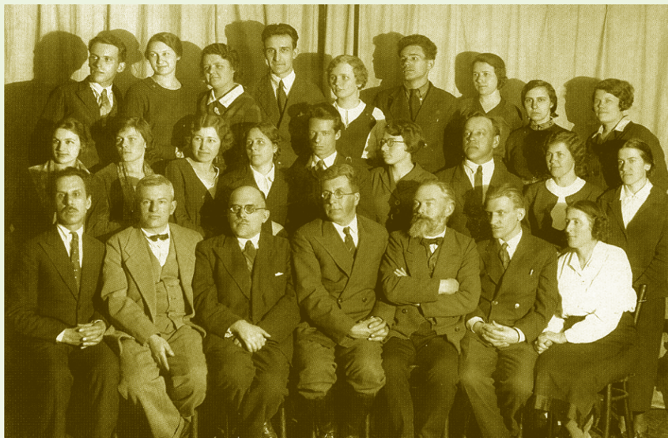
Кафедра геоботаники МГУ

Классические работы Алехина по курским степям вошли во все учебники ботанической географии и стали известны во всем мире, он автор учебника «География растений» для ВУЗов, ему принадлежит более ста печатных работ в области геоботаники.